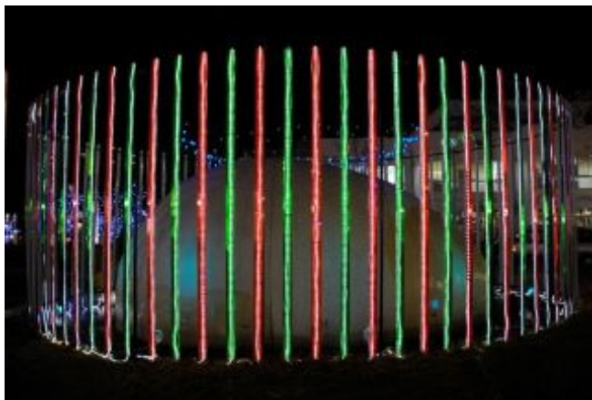
図 1: 右目用