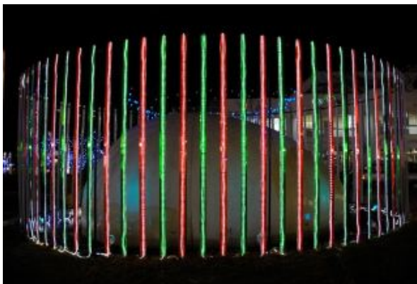
図 1: 右目用