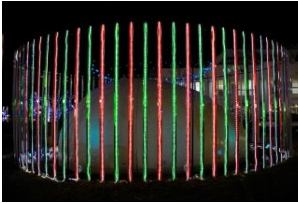
図 1: 右目用