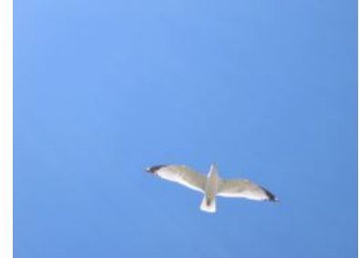
図 3: カモメ