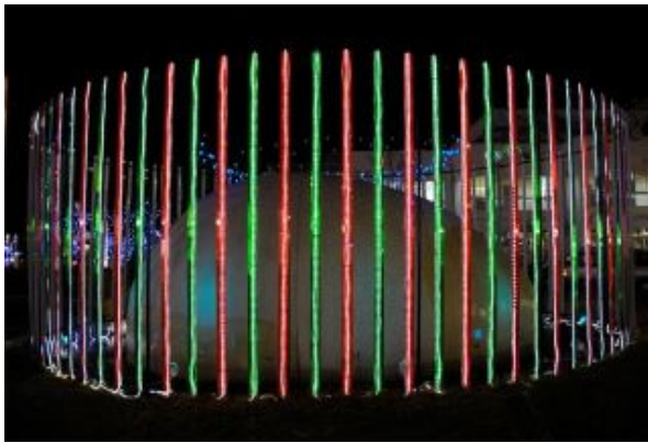
図 1: 右目用