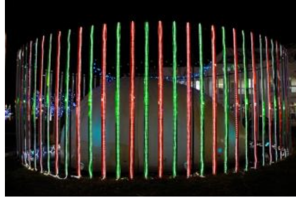
図 2: 左目用