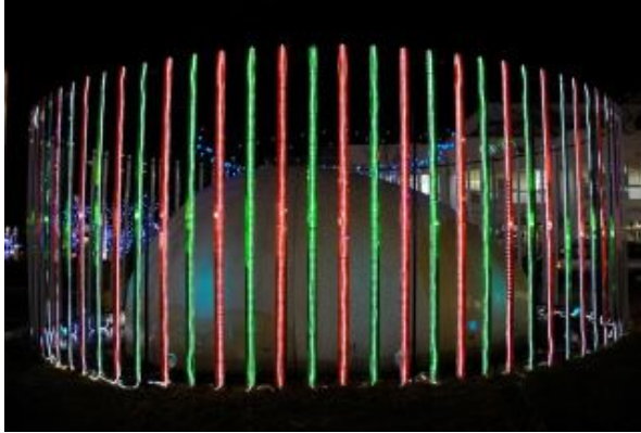
図 1: 右目用