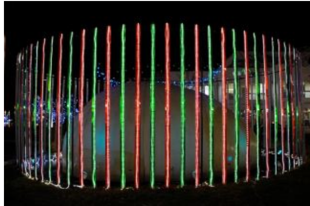
図 3: 左目用

また、寺村輝夫の研究 [3] によれば、昔、王子の誕生を祝って国民全員に卵焼きを提供すべく、軍隊を動員して象の卵を探させた王がいた。このときは孵化直後の子象は見つかったが、それが入っていた殻の発見には至っていない。人の家の裏庭の犬小屋を衛星写真で調べることもできなかった時代とあつては、この失敗も無理からぬことである。